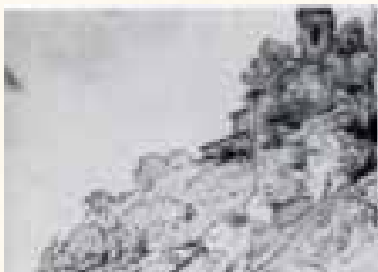
La chiesa di Maclino