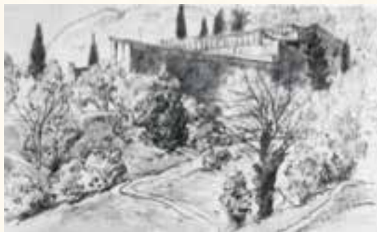
Limonaia a Bezzuglio