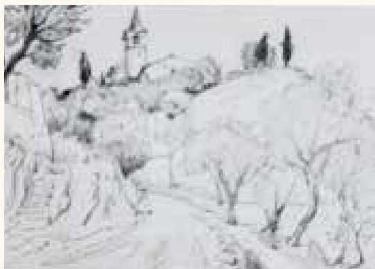
La chiesa di Gaino