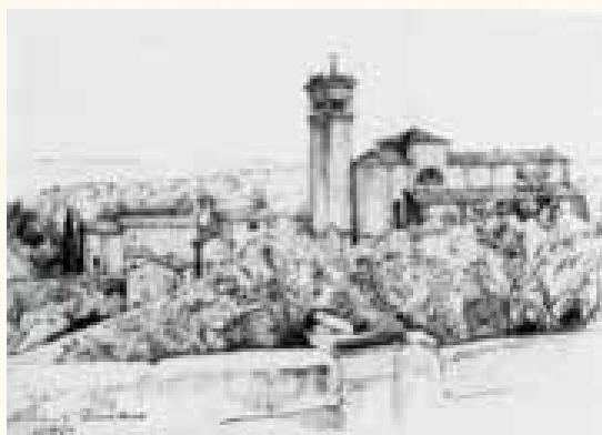
La chiesa di Toscolano ed il Santuario della Madonna di Benaco

Sì, sono questi i vicoli antichi, incassati tra alti muri, freschi, come quando ti dovetti lasciare, mio splendido rifugio autunnale!