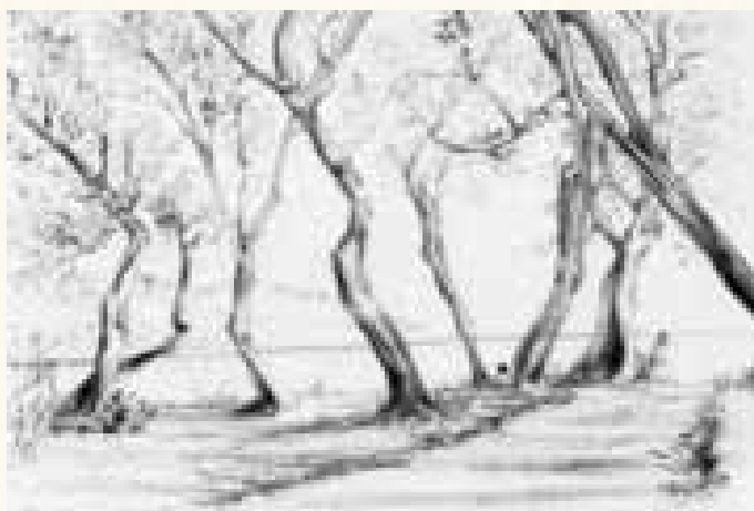
Il lago visto dal promontorio di Toscolano Maderno

Al poeta, nella locanda del Cavallo Bianco a Toscolano, fu assegnata una stanza rivolta sul giardino interno, per cui egli afferma: "Dall'unica finestra si aveva la vista al di là di un piccolo cortile, sul giardinetto ancora fiorito di dalie e rose tardive, chiuso alle spalle da una lunga serra dalla quale occhieggiavano una gran quantità di limoni gialli, e al di sopra di tutto le cime tondeggianti dei monti che si accendevano nel tramonto"