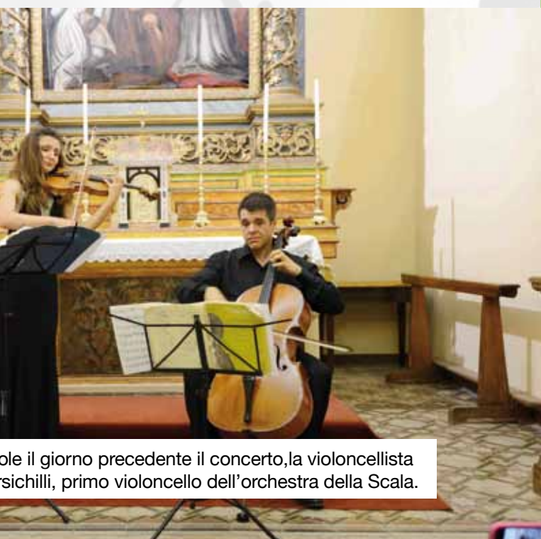
...ole il giorno precedente il concerto, la violoncellista ...schilli, primo violoncello dell'orchestra della Scala.